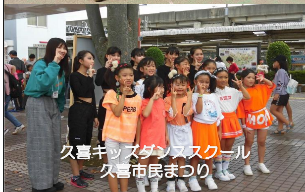
久喜キッズダンススクール 久喜市民まつり