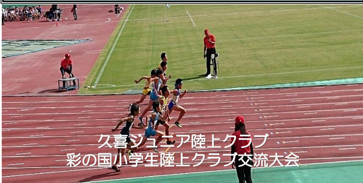
久喜ジュニア陸上クラブ 彩の国小学生陸上クラブ交流大会