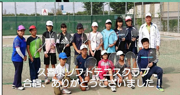
久喜東ソフトテニスクラブ 合宿、ありがとうございました!